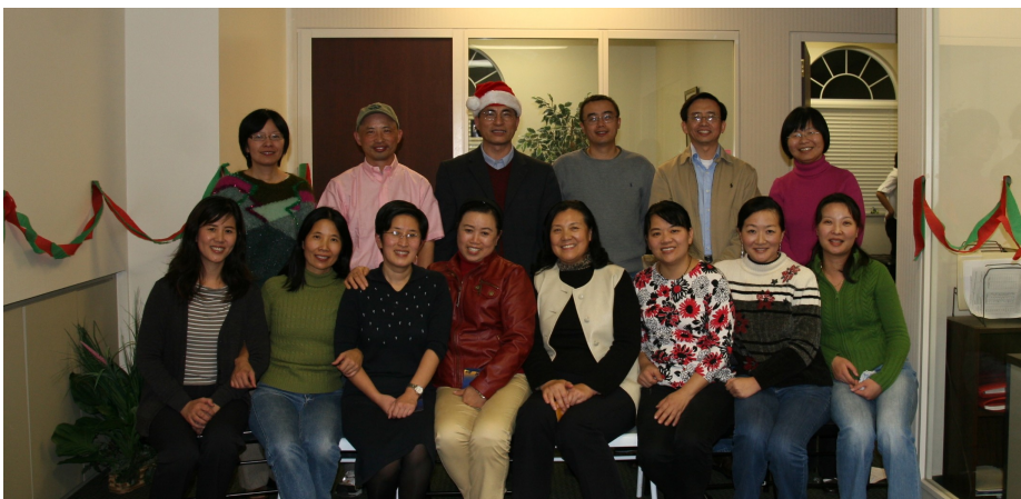
天柏中文学校部分教师与行政管理团队合影, 2010 12月11日